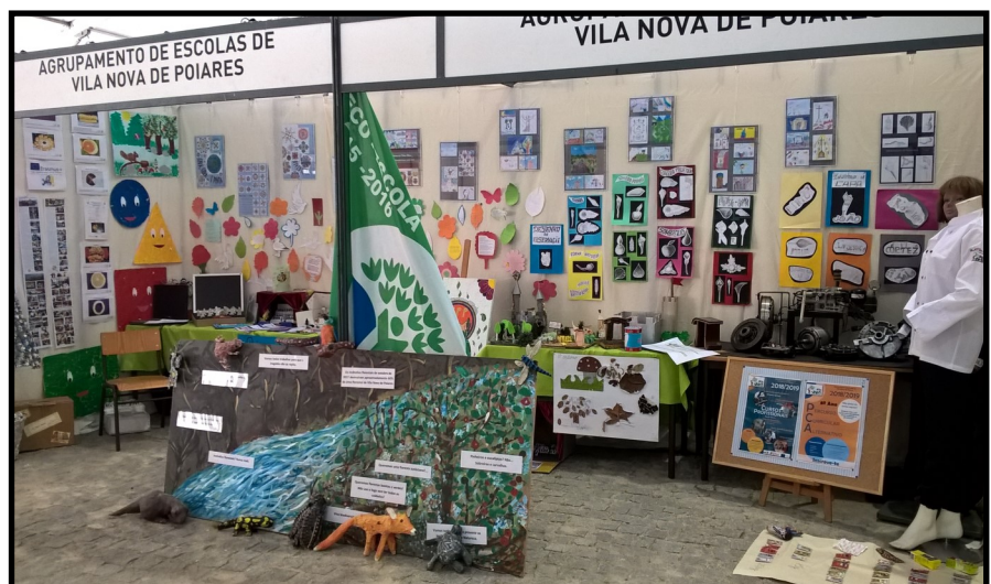
PoiArtes 6 a 10 set2018 — Espaço do Agrupamento