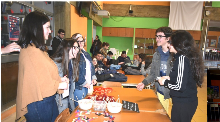
Associação de Estudantes

Mini-Negócio ARCA Food Connects Europe Erasmus+